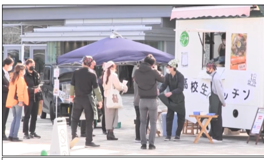
岐阜市役所での移動販売

試行錯誤を繰り返して、自分たちの作ったメニューが、多くの人に買ってもらえることを目指しています。